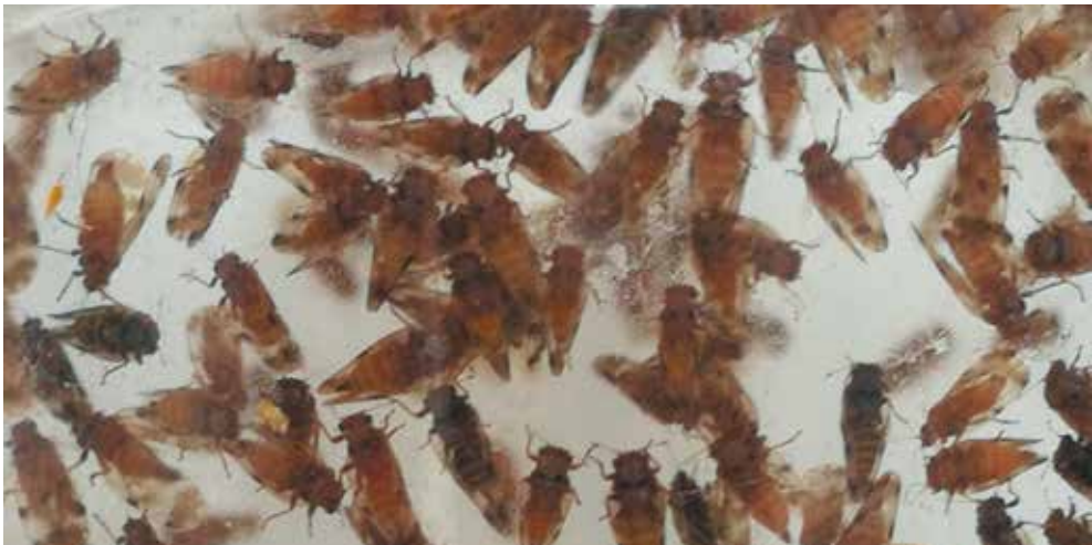
De Japanse bladvlo