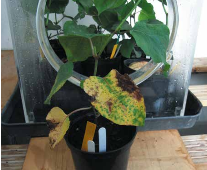
Aantasting duizendknoop door bladschimmel.