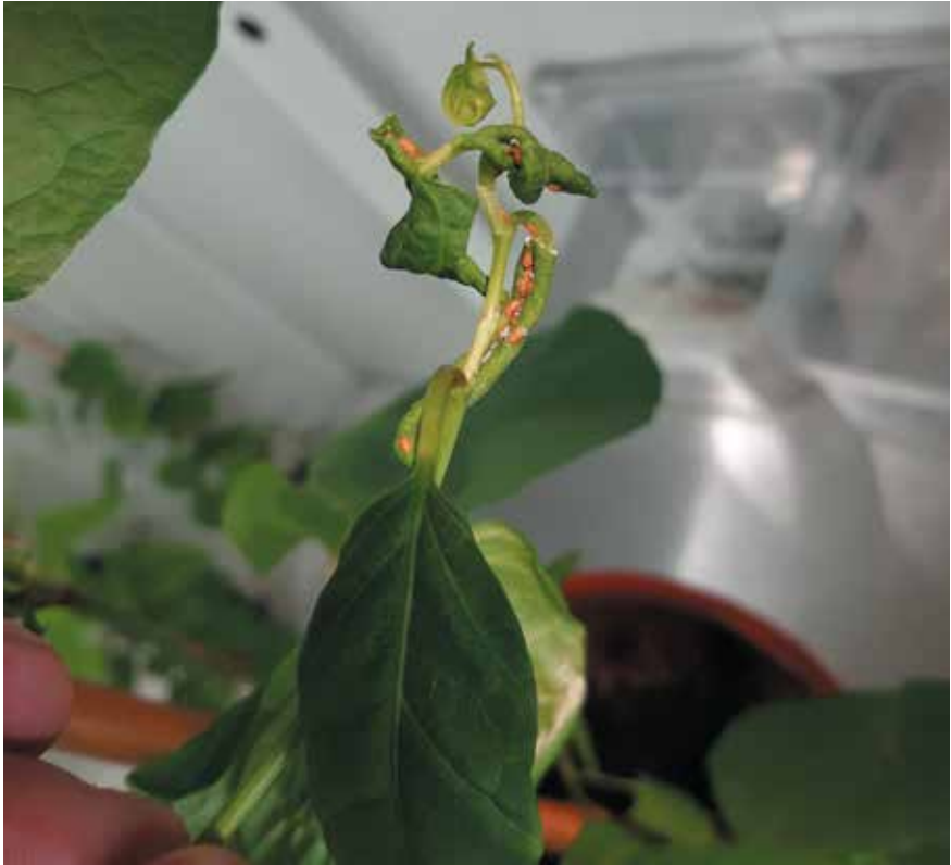
Aantasting duizendknoop door de Japanse bladvlo. De bruine beestjes op en in de aangetaste bladeren zijn de juvenielen van de bladvlo met hun witte suikerafscheiding.

male omstandigheden die er heersten in het laboratorium. Een fenomeen dat men vaker ziet. Een andere oorzaak kan zijn dat de klimatologische omstandigheden waar de uitgezette bladvlo vandaan komt (het zuiden van Japan) te veel afwijken van die in Engeland en andere West-Europese landen en de bladvlo daarvoor niet optimaal 'presteert'.